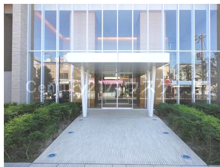
正面エントランス